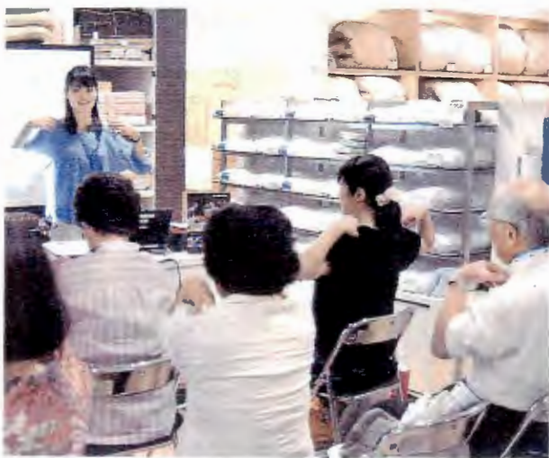
寝具メーカーが開く「快眠講座」には、睡眠について悩みのあるシニアの姿も=さいたま市